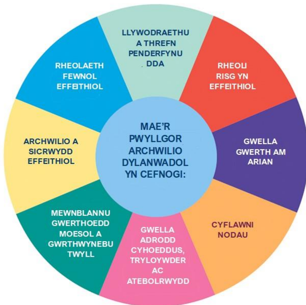
Ffigur 1: Y pwyllgor archwilio dylanwadol

Gellir defnyddio'r offeryn gwella isod i gefnogi adolygiad o effeithiolrwydd. Mae'n nodi'r meysydd eang lle bydd pwyllgor archwilio effeithiol yn cael effaith.